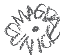
El Coro, 1998 Resina fundida, y técnica mixta Colección privada