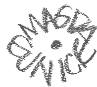
Sin título, 1985 Óleo y acrílico sobre tela Colección privada