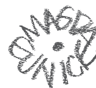
Taller de danza, 2005 Acrílico sobre tela 99 x 99.5 cm Colección privada