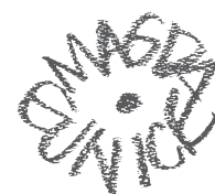
Sin título, 2006 Carboncillo y tiza sanguina sobre papel Colección privada