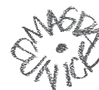
Sin título, 2003 Acrílico sobre tela 100 x 100 cm Colección privada