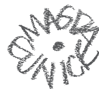
Sin título, 2000 Carboncillo y tiza sanguina sobre papel Colección privada