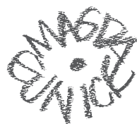
Sin título, s/f Terracota y técnica mixta 33 x 19 x 11.5 Colección privada