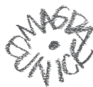
Galope, danza del alma, 2005 Acrílico sobre tela 140 x 250 cm Colección privada